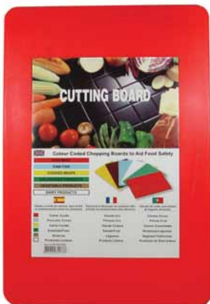
MODELO 621301 a 06